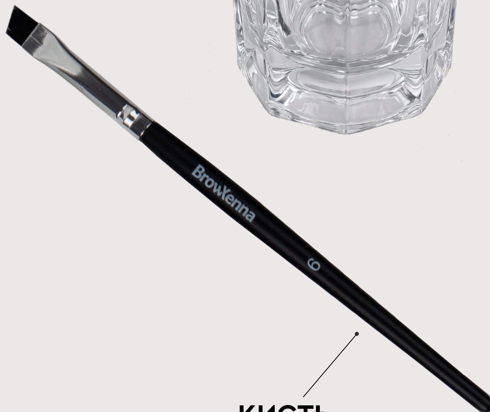
КИСТЬ для нанесения (в ассортименте)