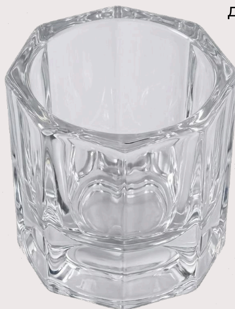
СТАКАНЧИК для разведения